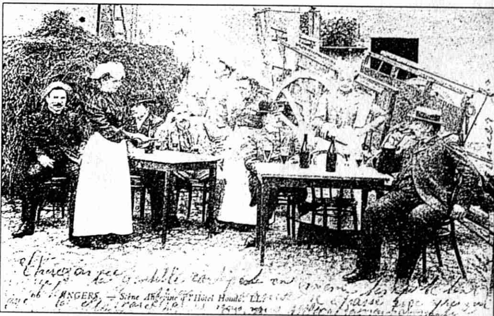
Hôtel Houdet (et non pas Houdé), 8 rue Boisnet : les « fillettes » angevines sont de sortie... Arch. mun. Angers, 4 Fi.